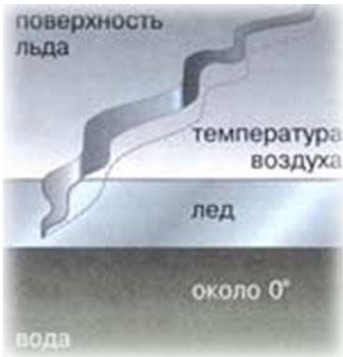
Рис.1. Разлом на поверхности льда, вызванный его температурной деформацией.

Однако хаотичность трещин на поверхности льда только кажущаяся, если помнить о механизме льдообразования: прежде всего в начале зимы, когда лед еще не везде одинаков по толщине, напряжения проявляются по границам стыковки толстого и тонкого ледового покрова, то есть там, где мелководье резко переходит в глубину. При этом глубокая сторона водоема будет определяться по близко располагающейся к обычно крутому берегу трещине, и наоборот.