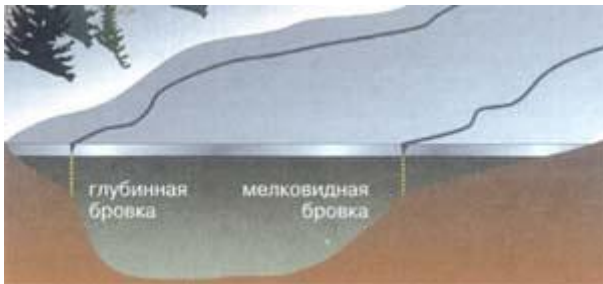
Рис.2. Образование первичных трещин в местах стыковки льда с различной толщиной.

Однако хаотичность трещин на поверхности льда только кажущаяся, если помнить о механизме льдообразования: прежде всего в начале зимы, когда лед еще не везде одинаков по толщине, напряжения проявляются по границам стыковки толстого и тонкого ледового покрова, то есть там, где мелководье резко переходит в глубину. При этом глубокая сторона водоема будет определяться по близко располагающейся к обычно крутому берегу трещине, и наоборот.