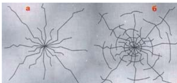
Рис.4. Типы растрескиваний льда под нагрузкой: а – радиальные трещины, не ведущие к провалу груза; б – радиальные трещины, сопровождаемые концентрическими разрушениями, ведут к быстрому провалу груза.

Об упругих свойствах льда говорят следующие количественные данные. Если рассматривать прозрачный, наиболее прочный лед, то при центральном прогибе его в 5 см трещин на нем не образуется; прогиб в 9 см ведет к усиленному образованию трещин, прогиб в 12 см вызывает сквозное растрескивание, при 15 см лед проваливается. Трещины под действием нагрузок возникают двух типов: радиальные (рис.4-а) и концентрические (рис.4-б).